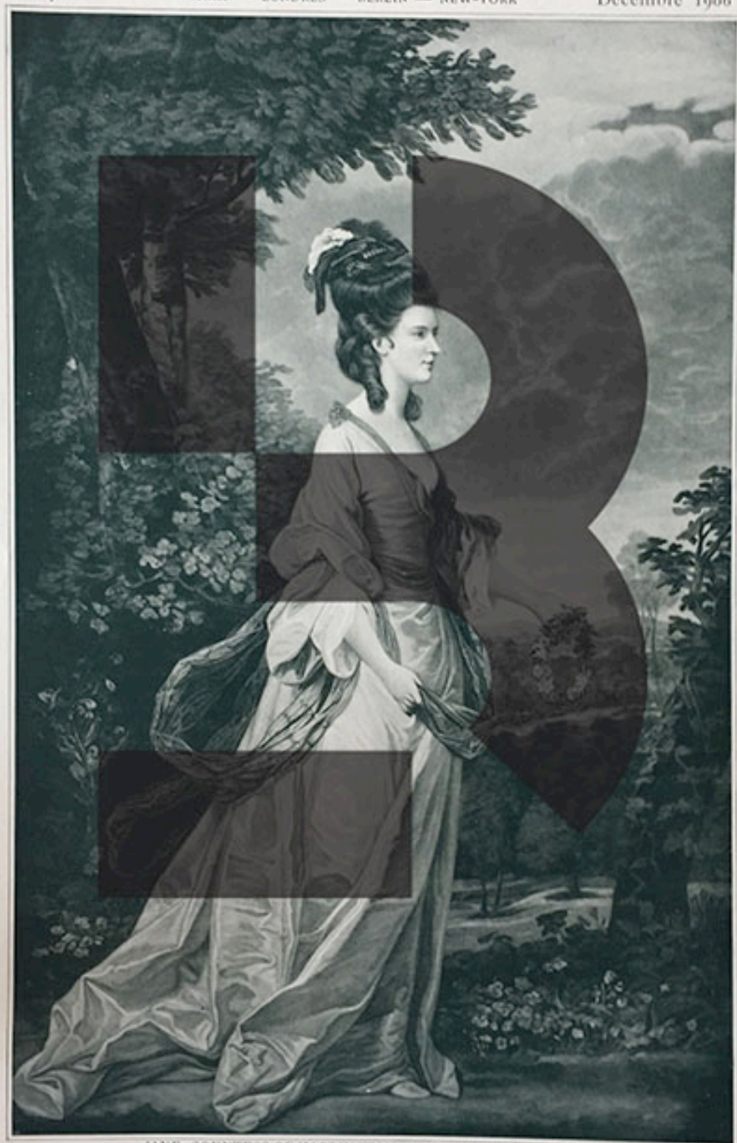
JANE, COUNTESS OF HARRINGTON, PAR SIR JOSHUA REYNOLDS Prime gratuite offerte par les Éditeurs du Journal LES MODES à leurs Abonnés de 1907 Gravure en taille-douce mesurant hors marges : 0 m 59 x 0 m 38