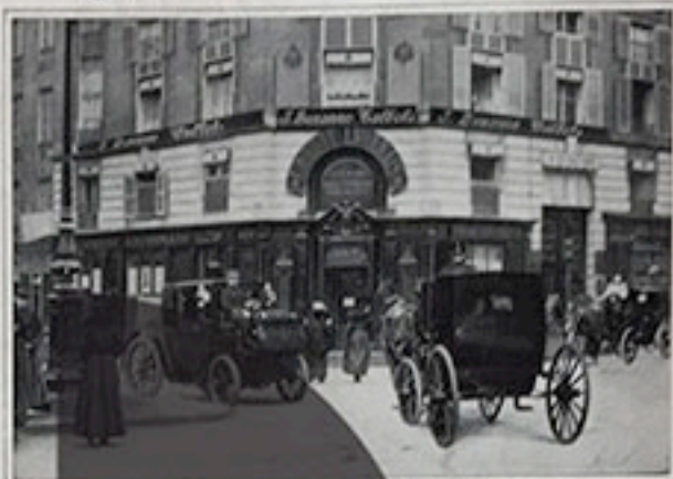
14, RUE ROYALE Téléphone : 215-51