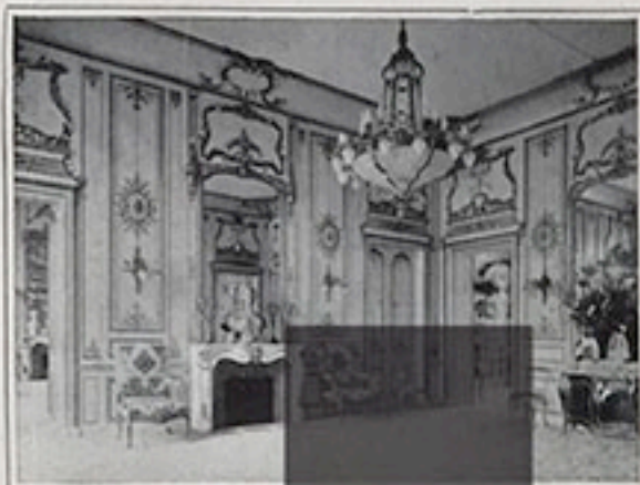
MARTIAL & ARMAND 10, PLACE VENDÔME Même Maison : 13, RUE DE LA PAIX